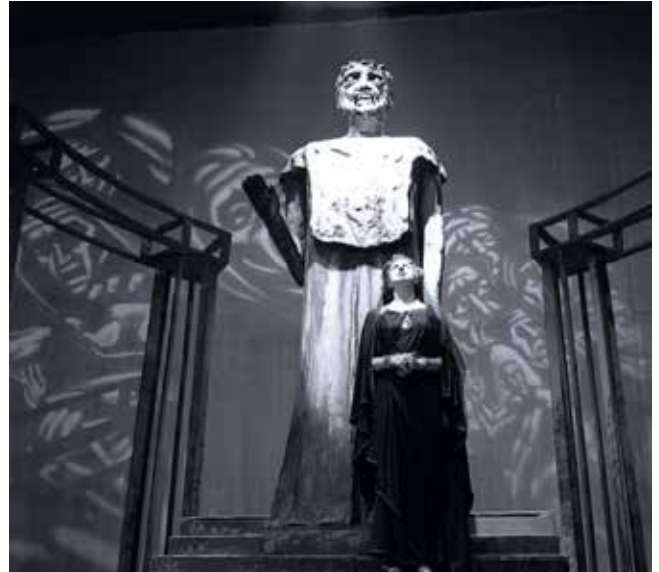
Scene from Jean-Paul Sartre's play "The Flies", New York 1947 Szenenfoto aus Jean-Paul Sartres Stück "Die Fliegen", New York 1947

A revolving stage allowed for smooth changes between