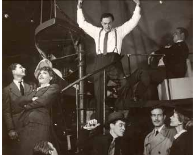
Scene from „All the King’s Men“ by Robert Penn Warren Szene aus Robert Penn Warrens Stück „All the King’s Men“

Schließlich „All the King’s Men“, eine Bearbeitung von Robert Penn Warrens Roman, die 1948 im President Theater gezeigt wurde. Die Hauptfigur Willie Stark basiert auf Huey P. Long, dem Gouverneur von Louisiana, der seine politische Laufbahn als Idealist begann und, durch seinen Machttrieb korrumpiert, zu einem demagogischen Diktator verkommt. Für die Weiterentwicklung des epischen Theaters ist dieses Stück deshalb so bedeutsam, weil Piscator zum ersten Mal zwei verschiedene Sprecher einsetzte, einen dem Stück immanenten Sprecher und einen zweiten, der