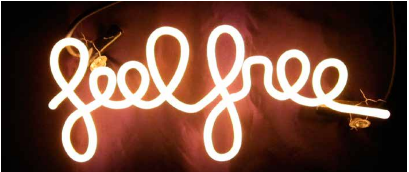
Neon sign outside the entrance to the "Spaceship Kaleidoscope" Leuchtschild am Eingang zum "Spaceship Kaleidoscope"

Some people passed by while others stopped and stayed with me for a while. Some jeered and mocked me. Others were scared. And the flow of traffic never stopped. The weather had gone from sunny to gray and breezy. I shivered and shed tears. Though I felt safe as a performer, I was overwhelmed with sadness at times. Eventually I was buoyed by the support of strangers. Someone raised a peace sign to me; another person was speaking out.