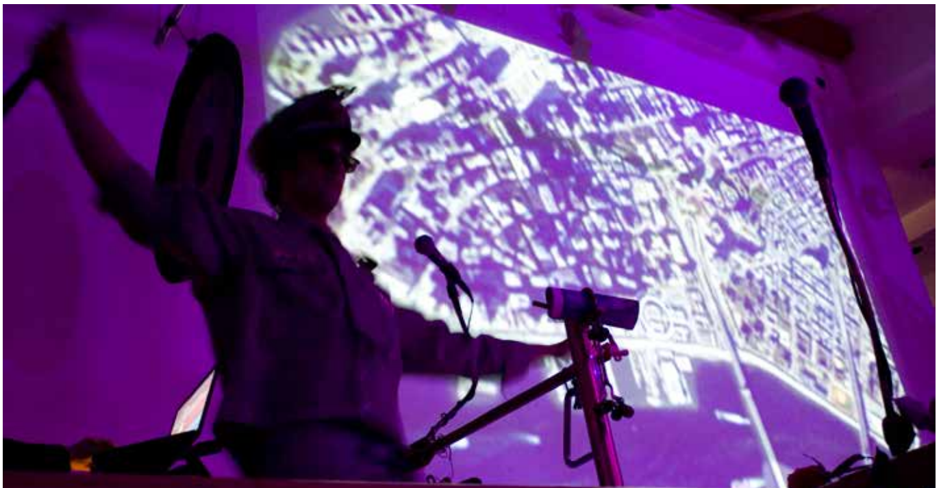
Captain Wally launches the Spaceship Kaleidoscope from Lower Manhattan during Spaceflight 18's Maiden Voyage in 2010 Kapitän Wally schießt das Raumschiff Kaleidoscope 2010 von Manhattan aus ins All - die Jungferreise "Spaceflight 18" beginnt

Dienstag, 25. April 2005, Astor Place, 15.00 Uhr