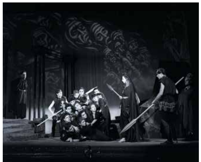
Group scene from Sartre’s play „The Flies“ Gruppenszene aus Sartres Stück „Die Fliegen“