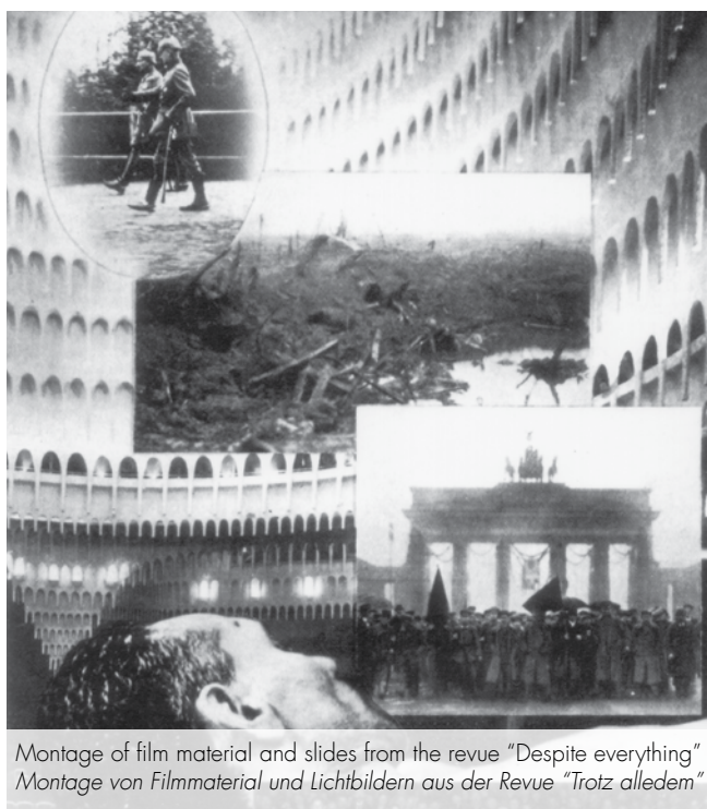
Montage of film material and slides from the revue "Despite everything" Montage von Filmmaterial und Lichtbildern aus der Revue "Trotz alledem"

The stage architecture was of utmost importance. It served two purposes primarily. On the one hand, it had to clearly indicate the fundamental aspects of the play's concerns and, on the other, enable the usage of special lighting technology, projections and film, as well as facilitate swift changes in or the simultaneous display of scenic actions and audio-visual material. Already in 1927, Walter Gropius designed a so-called "total theatre," which was completely variable, for this purpose. The stage and the auditorium – which had no balconies – could be shifted in such ways that different spaces emerged – creating an arena or a proscenium or a thrust theatre. It would have been possible to use fourteen screens for film and projections all around the single-space theatre. It was never built and Piscator had to make do with other means. Regarding "Schwejk", for example, Piscator proceeded from the "assumption of an uninterrupted and unceasing course of action." In order to evoke this idea in the spectator, two parallel conveyor belts of three meters width each were set up on stage. They could be switched on or off independently of each other. They transported actors, parts of the decoration and props onto the stage.