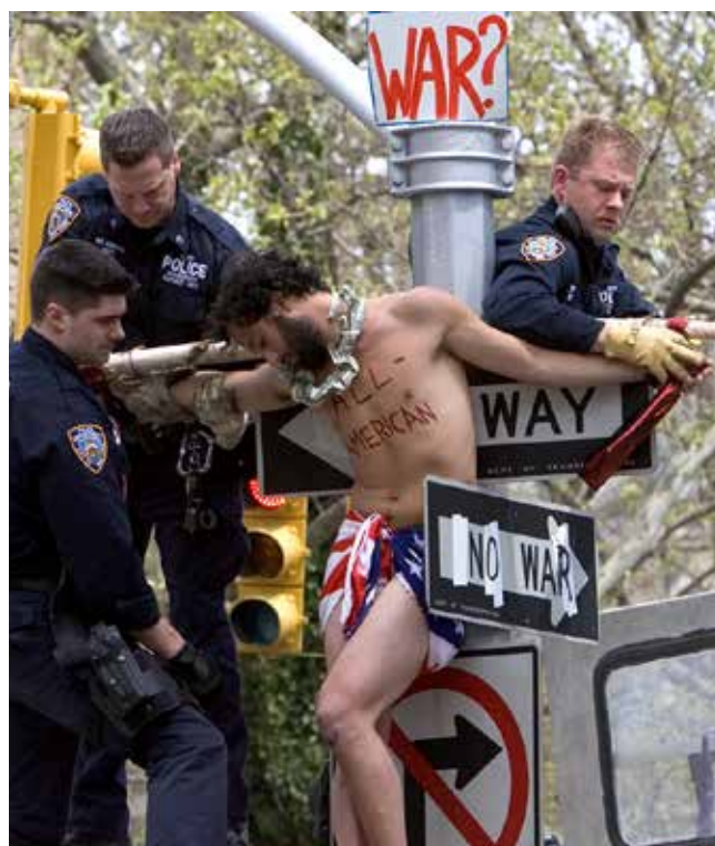
Radical Jew, 33 is taken off the cross by the police Der Radikale Jude, 33 wird vom Kreuz abgenommen (2)