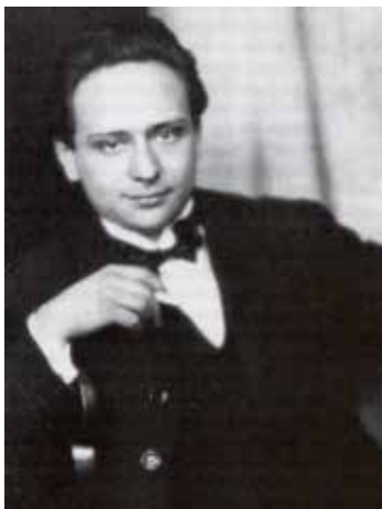
Composer Viktor Ullmann Komponist Viktor Ullmann (1)