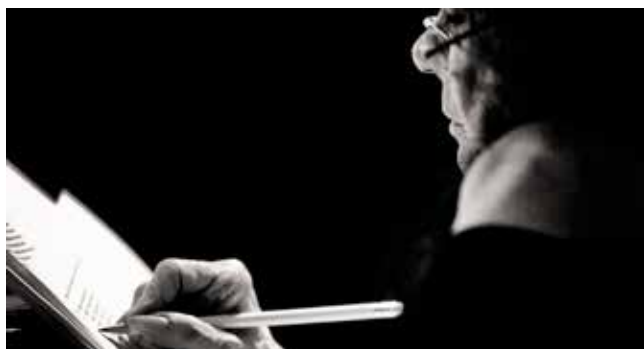
Judith Malina taking notes during rehearsals Judith Malina macht Notizen während der Proben

Aber die Zuschauer wirklich einbinden, so daß sie darüber nachdenken müssen, was sie als nächstes tun wollen, sie tatsächlich einbeziehen in die Entscheidungsprozesse.