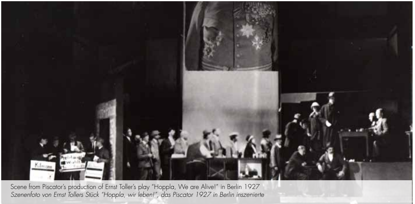
Scene from Piscator's production of Ernst Toller's play "Hoppla, We are Alive!" in Berlin 1927 Szenenfoto von Ernst Tollers Stück "Hoppla, wir leben!", das Piscator 1927 in Berlin inszenierte

production of Ehm Welk's "Gewitter über Gottland" (Storm Above Gottland, 23 May 1927) at the Volksbühne caused a scandal resulting in his decisive break with the Volksbühne. At the beginning of the performance, the film was used as a "historical survey:" "The characters of the spectacle, which include Störtebeker and Asmus, walk towards the audience in the film and as they march they change their clothes until Asmus has turned into Lenin" (Herbert Ihering). While the critic Alfred Kerr considered this "unforgettable cinematic images" one of the "most shattering film images," the Board of Directors of the Volksbühne regarded it as a provocation. They demanded that these parts be cut out of the film, because they deemed them a "tendentiously political rearrangement and elaboration that is not inherently necessary." They were determined to maintain the "fundamental political neutrality of the Volksbühne."