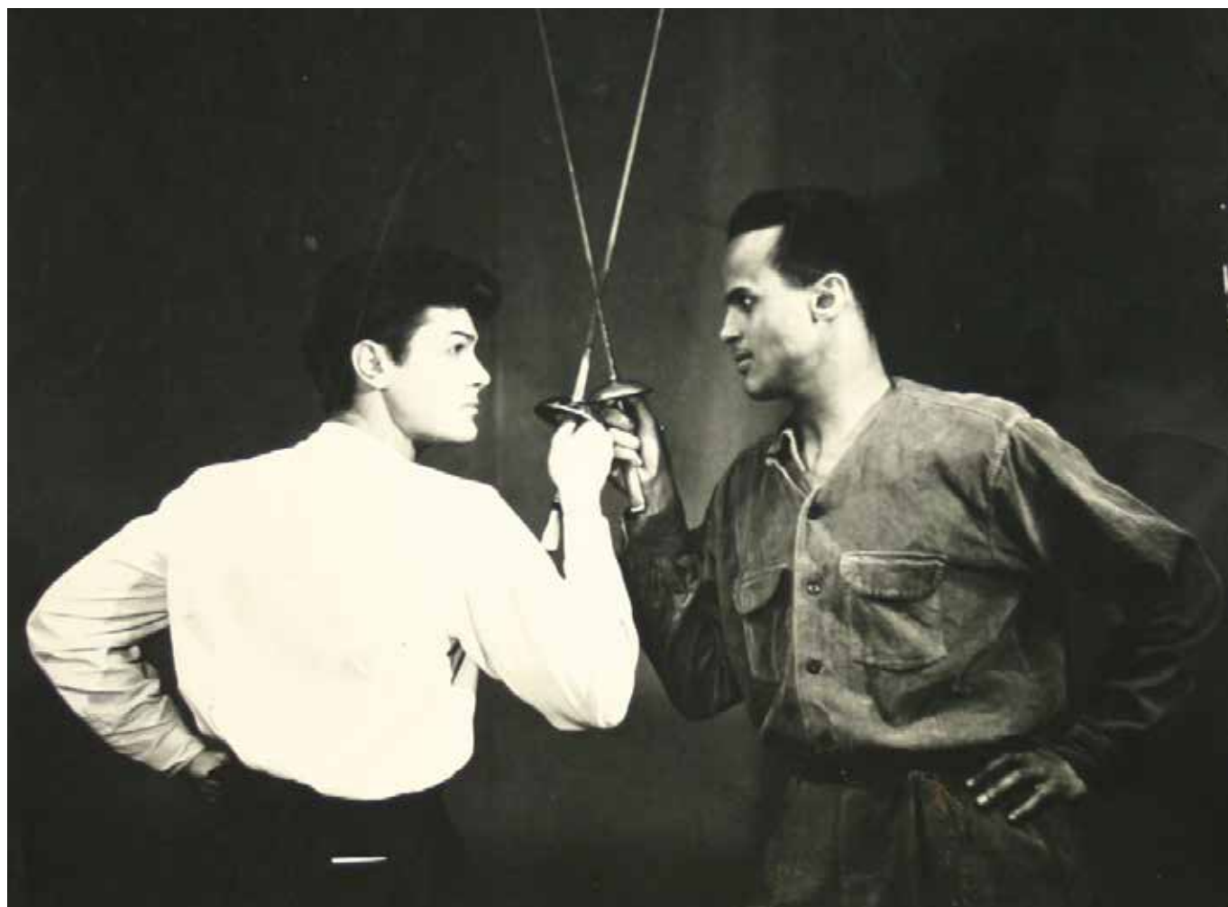
Tony Curtis (left) and Harry Belafonte both were students at Erwin Piscator's Dramatic Workshop Tony Curtis (links) und Harry Belafonte waren beide Studenten von Erwin Piscator am Dramatic Workshop

Zur Eröffnung des Studio Theaters wollte Piscator nicht irgendein Stück präsentieren sondern eines, das als seine Visitenkarte dienen sollte. Seine Wahl fiel auf Shakespeares „König Lear“. Er deutete Lear als Allegorie moderner Diktatur und Tyrannei und stellte den Aufstand gegen Lear als Revolte gegen den Faschismus dar. Er nutzte ein aufwendiges System aus 32 Lautsprechern, mit denen er Geräusche reproduzierte und kontrollierte. Die Kritiker verwarfen Piscators Inszenierung fast durchweg als „gekünsteltes, anmaßendes und stark teutonisches Historienspiel.“ Etliche Theaterbesucher sprachen sich in Leserbriefen gegen die antideutsche und antimoderne Haltung aus, die aus vielen