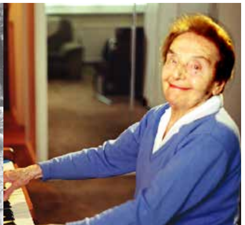
Pianist Alice Herz-Sommer survived the Holocaust (3) Pianistin Alice-Herz-Sommer überlebte den Holocaust