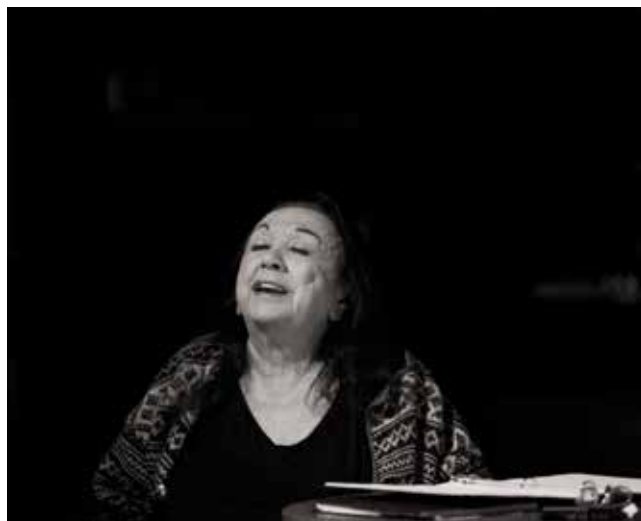
Judith Malina during rehearsals at The Living Theatre Judith Malina bei der Probenarbeit im Living Theatre

We have a little bit of experience in that, too. One play that we did in relation to labor problems is – and we sometimes still do – "The Strike Support Oratorium" which we do walking along the street and then supposedly barricading a store that sells certain goods – at that time we did it for the grapes and lettuce workers, who are all very underpaid, Latinos and Mexicans. I don't know how to say whether it was successful or not. When you do a street-play there is a certain kind of success about the way how people react to that. But you can't count it the same way you can say: Piscator's play succeeded or didn't succeed. Because, while Piscator worked for all his life toward opening up the actor and the audience, he never did it. The big thing he talked about: he never did