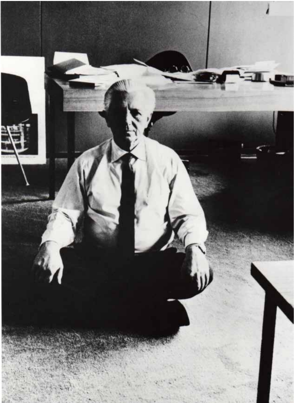
Piscator in his Berlin apartment in 1965. Even at age 72 he daily did gymnastic exercises Piscator in seiner Berliner Wohnung, 1965. Mit 72 Jahren machte er noch täglich Gymnastikübungen